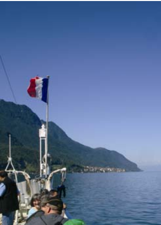
Un cap à maintenir pour le bien du village

Je veux remercier tous mes collègues des différents conseils avec lesquels j'ai siégé durant toutes ces années, remercier le personnel administratif, le personnel communal et toutes les personnes qui ont travaillé dans l'intérêt de notre belle commune.