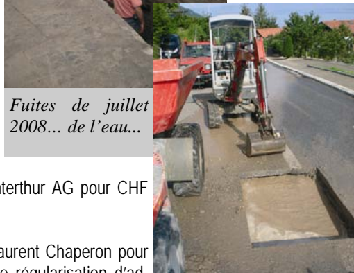
Fuites de juillet 2008... de l'eau...

Accepte les travaux supplémentaires pour bétonner le mur qui longe la Morge et poser des barrières de sécurité pour un surcoût de CHF 1'500.-.