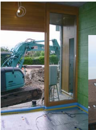
construction qui avance ... notre école en hiver 2008