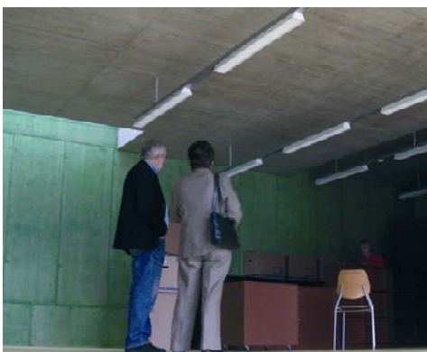
La nouvelle bibliothèque avant l'arrivée des livres... et du matériel