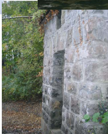
Réservoir au-dessus du village