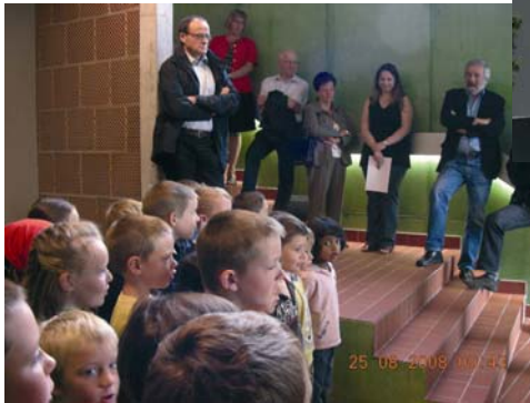
Des chants de remerciement à nos généreux donateurs

« L'inauguration fut un grand moment pour les habitants de notre village et chacune des personnes présentes retient parmi les images et les sons le sourire et les rires des enfants fiers de présenter leur nouvelle école à leurs parents »