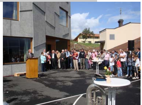
Des discours, des sourires, un résultat

Nous continuerons cet effort dans la prochaine législature. En effet, notre commune participera, dans le cadre de la collaboration intercommunale, à la nouvelle construction du cycle régional de Vouvry. Ainsi, l'exécutif agit en prévoyant la formation de demain. Nous vous tiendrons au courant des travaux et des coûts tout au long de la législature prochaine.