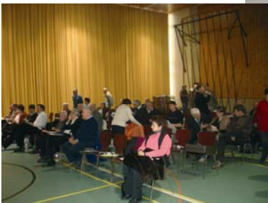
Grenelle du Tonkin le 29 novembre, un pari sur l'avenir?

La Berne fédérale et la capitale de notre canton doivent savoir que cette ligne est appelée à devenir internationale et être une nouvelle union entre les gens du Léman.