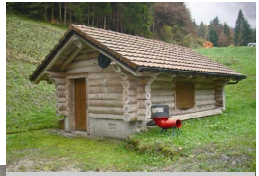
Installation de Clarive

«Ce nouveau défi sera présenté à la population le lundi 26 janvier à 20h00 à la salle des sociétés du Château bourgeois.»