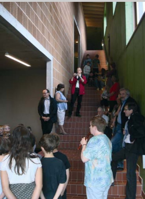
Un escalier imposant vers la connaissance, que de changements...