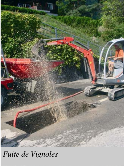
Fuite de Vignoles

La question qui semble hanter plus d'un habitant de notre village. Quand turbinerons-nous nos eaux ?