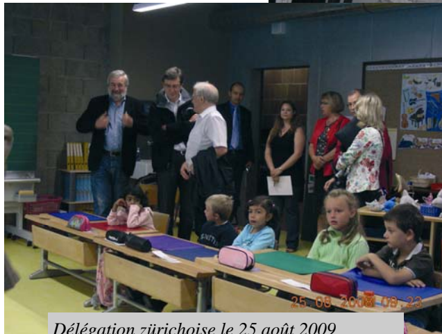
Délégation zürichoise le 25 août 2009

Même les représentants de la ville de Zürich furent séduits par la conception efficace et le coût modeste (Avec le même montant investi, à Zürich, on ne construit qu'un kiosque... avoua un délégué). Ils nous firent l'honneur de visiter notre école le 25 août 2008. Les enfants les remercièrent de leur généreux don (100'000.- grâce à l'envoi d'un simple dossier) par des chants. Notre appel au don a permis de récolter le montant de 300'000 frs.