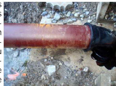
Une gestion de tous les instants, pour entretenir le réseau d'eau