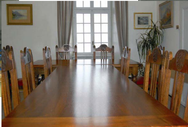
Le nouveau conseil avec son nouveau visage se réunira la première fois le lundi 12 janvier 2009 pour une nouvelle législature.

Accepte l'offre de Trisconi-Anchise pour des rayonnages complémentaires pour la bibliothèque de CHF 2'650.- l'unité et gradin à 3 niveaux pour CHF 1'170.- l'unité et Bac à livres sur roulettes de CHF 1'970.- l'unité. Pose d'un paravent dans la salle d'appui pour CHF 685.-.