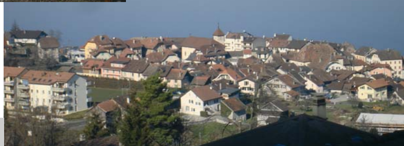
Un village qui s'agrandit

De même, nos containers ne sont pas des bennes de chantiers pour particuliers lancés dans des transformations. Nous les prions de louer une benne ou d'apporter leurs déchets de chantiers à la déchetterie.