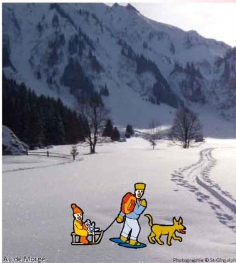
Au de Morge

LOCATION RAQUETTES À NEIGE FERME DIMANCHE SOIR ET LUNDI